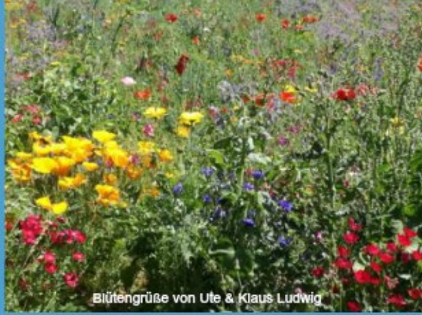
Blütengröße von Ute & Klaus Ludwig