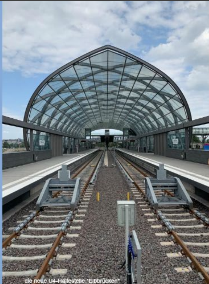
die neue U4-Haltestelle "Eisbrücken"