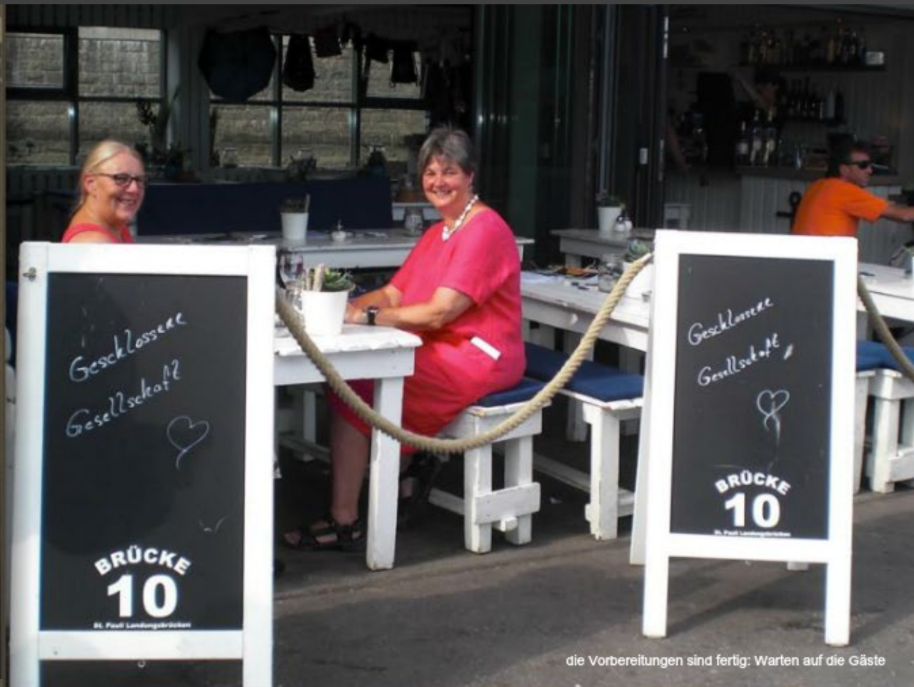
die Vorbereitungen sind fertig: Warten auf die Gäste