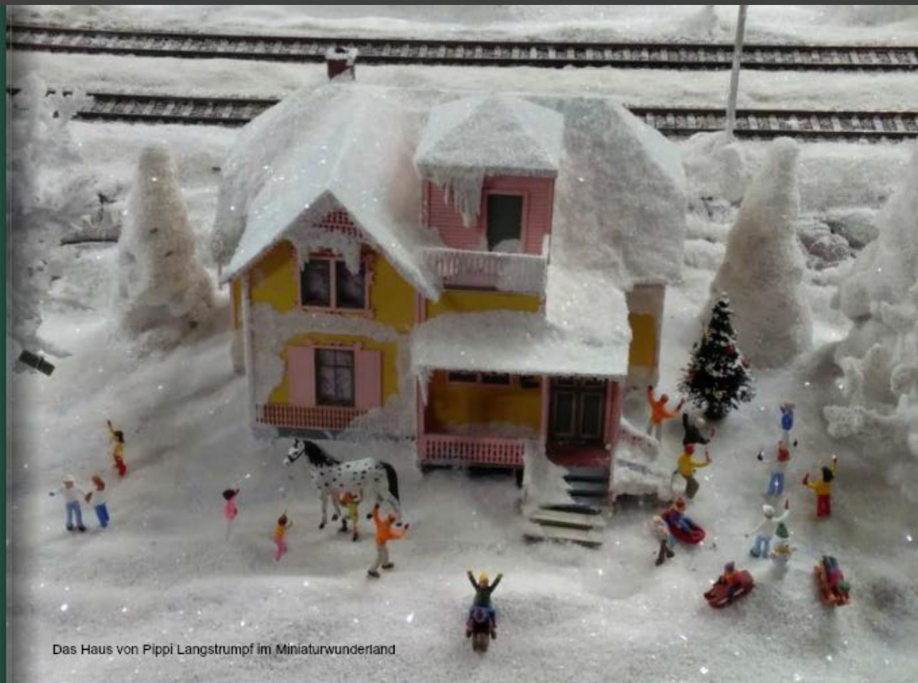
Das Haus von Pippi Langstrumpf im Miniaturwunderland