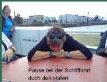
Pause bei der Schifffahrt durch den Hafen