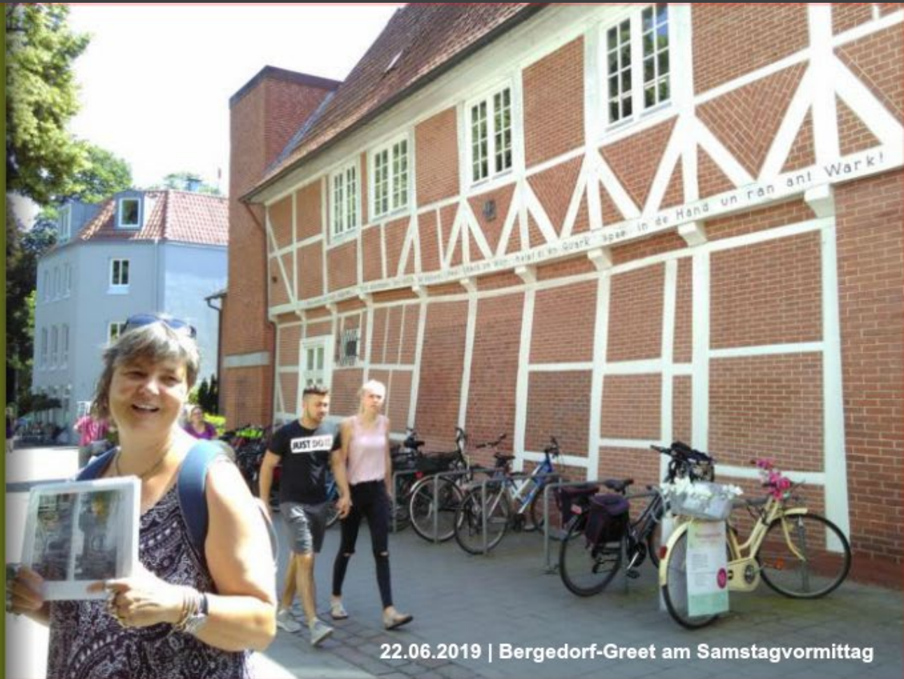
22.06.2019 | Bergedorf-Greet am Samstagvormittag