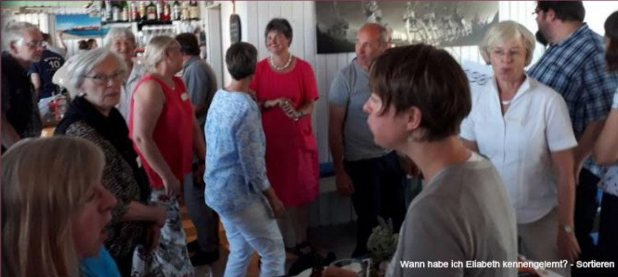
Wann habe ich Eilabeth kennengelernt? - Sortieren