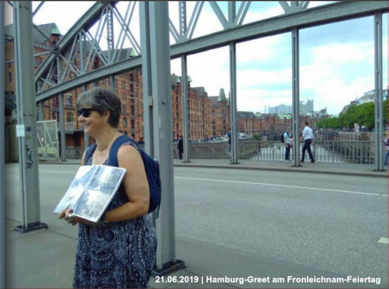
21.06.2019 | Hamburg-Greet am Fronleichnam-Feiertag